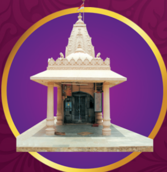
પ્રસાદીનું શિવજી મંદિર