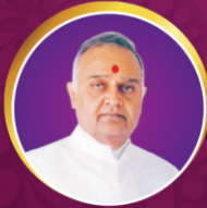
प.पू. मोटा महाराजश्री