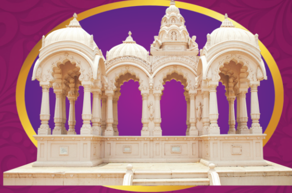
અમદાવાદ દેશના આચાર્યોની સ્મૃતી છત્રી