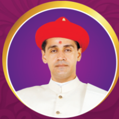
प.पू.ध.धू. आचार्य महाराजश्री