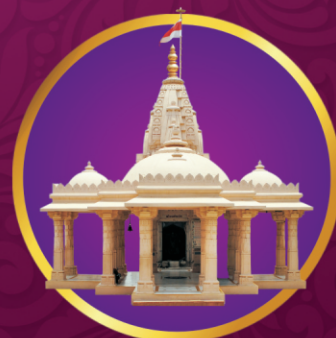
પ્રસાદીનું હનુમાનજી મંદિર